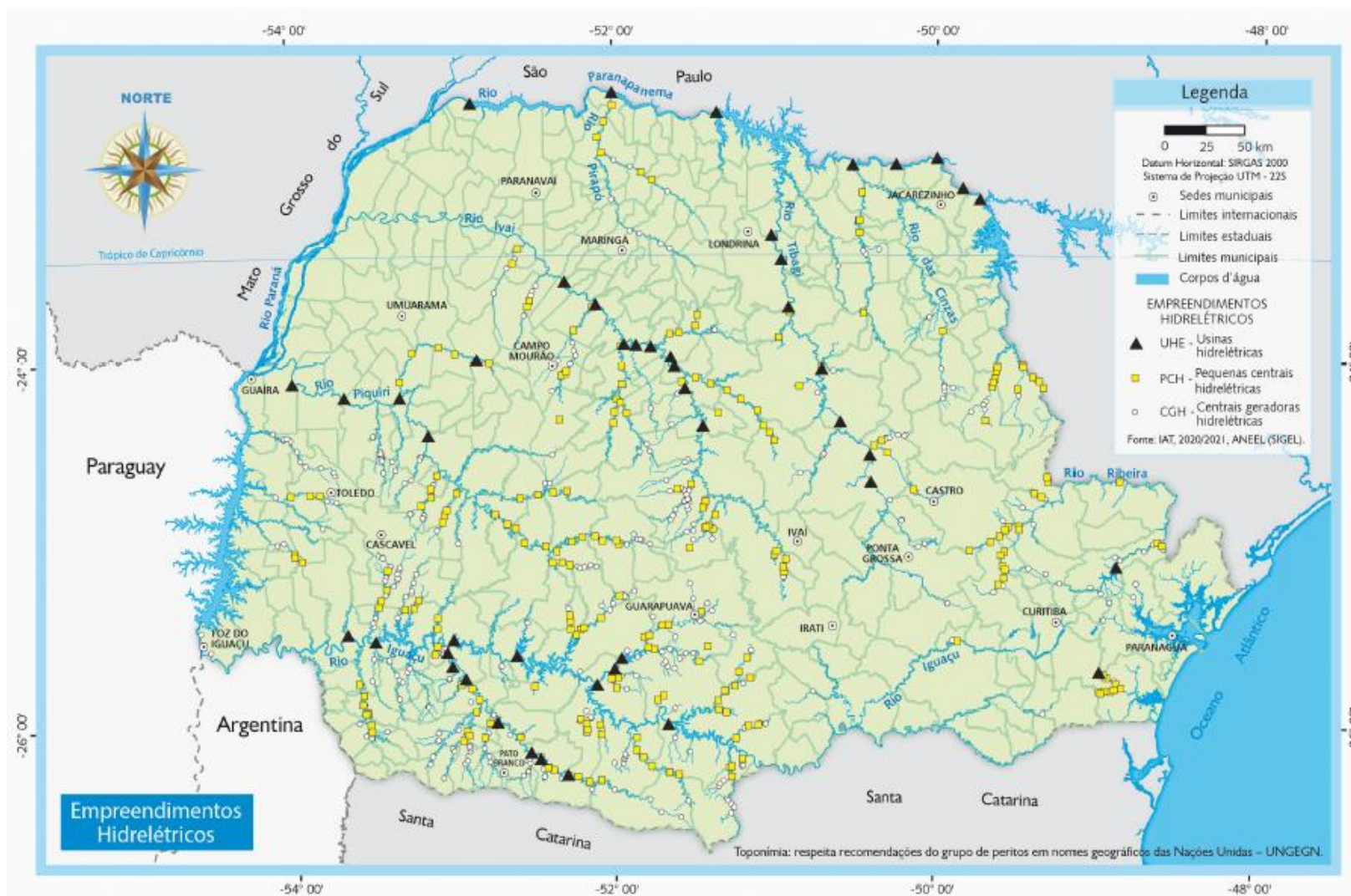
Figura 2: Mapa divulgado pelo governo do estado do Paraná em 2021 em relação aos supostos empreendimentos hidrelétricos.